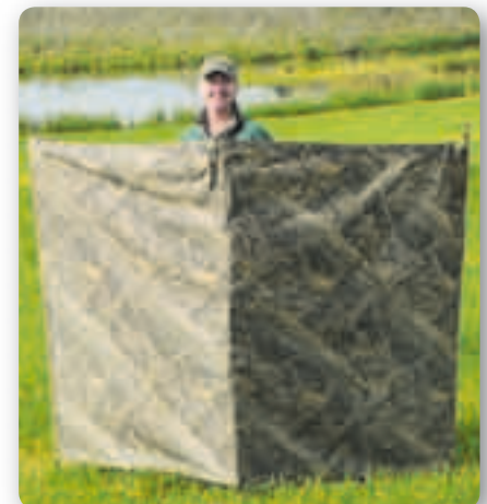
Een zogenaamde "hide" welke veel gebruikt wordt in de USA.