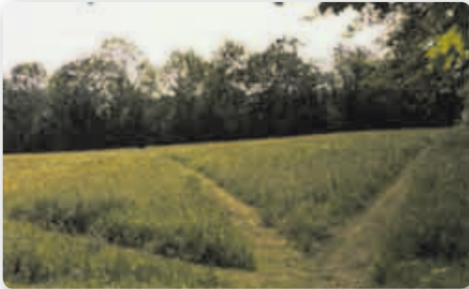
De "tuin" van Stan Palmer was helemaal aangepast aan het lijnen lopen. Sommige lijnen waren 300 meter lang en er werd ook gewerkt in hoeken van 90 graden.