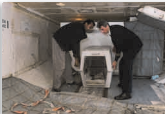
De luchtkennel wordt met alle zorg geplaatst en vastgesnoerd. De temperatuur tijdens de vlucht is ca. 18 graden.