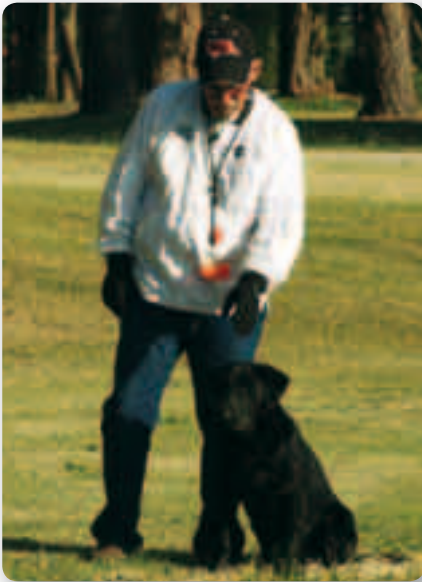
Handler in het witte jasje.

Het gebeurt ook wel eens dat een levende eend, die altijd door 2 geweren beschoten wordt, toch slimmer blijkt te zijn en het er levend vanaf brengt. Voor de voorjager is dit absoluut geen pretje. De hond is vaak volkomen gefixeerd door alle schoten op die ene eend en is zijn andere apport vaak helemaal vergeten. Men noemt dit "sluice" het afschieten van de