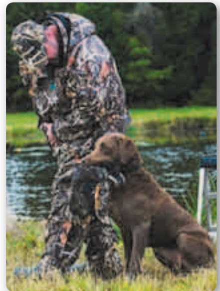
Camouflagekleding voor de huntingtesten.

Tijdens deze proef wordt één levende eend geschoten en één dode eend opgeworpen.