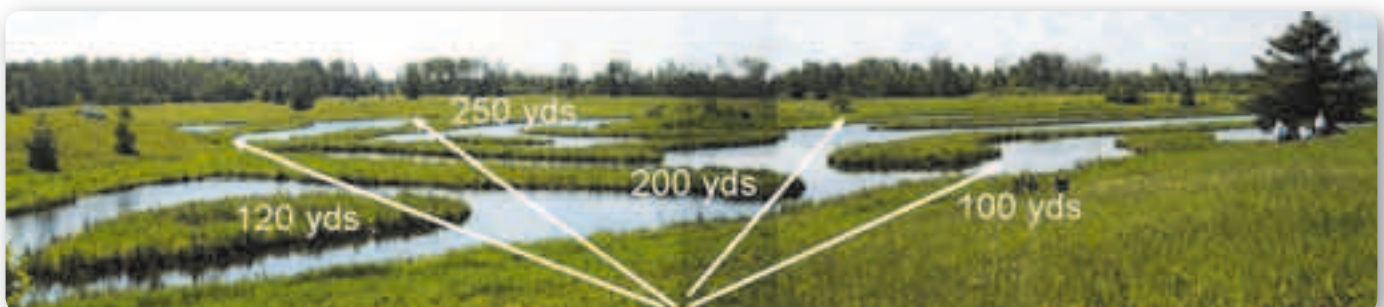
Een idee hoe zwaar de proeven zijn.

Ook hier een dubbel markeer op het water en één blind. Voor het waterwerk weten ze altijd stukken te vinden met veel en hoog riet. De honden moeten echt scherp markeren en GOED ONTHOUDEN.