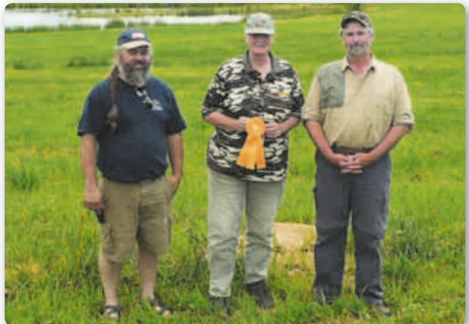
De felbegeerde ribbon